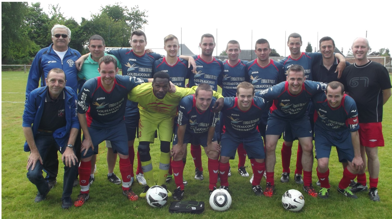
L'équipe seniors première, qui a gagné successivement son dernier match de championnat contre Péronne 2 son match de Coupe de France contre Daours.

Après quatre années de galère au niveau des résultats, l'entente sportive Ste Émilie/Épehy se réjouit d'observer un certain renouveau.