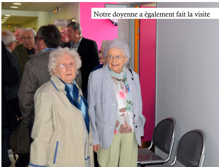
Notre doyenne a également fait la visite

Enfin, le pot de l'amitié a clos cette belle matinée que l'on peut qualifier de festive tant tous les participants étaient heureux. M.D.