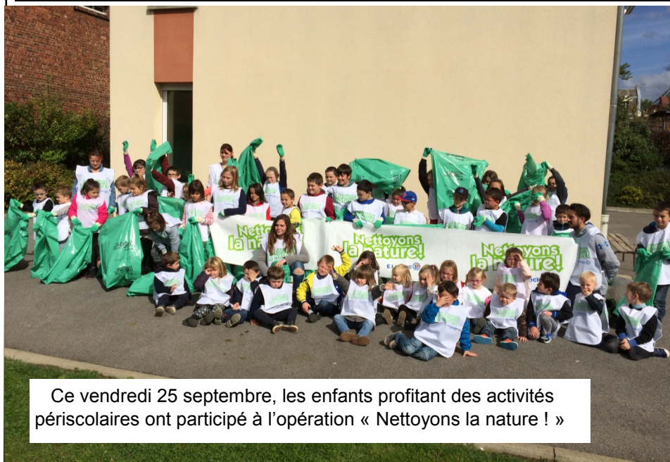
Ce vendredi 25 septembre, les enfants profitant des activités périscolaires ont participé à l'opération « Nettoyons la nature ! »