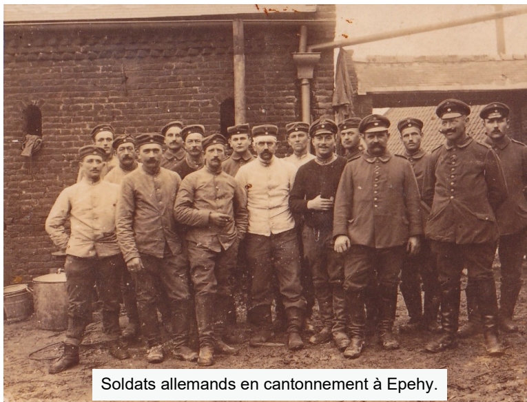
Soldats allemands en cantonnement à Epehy.