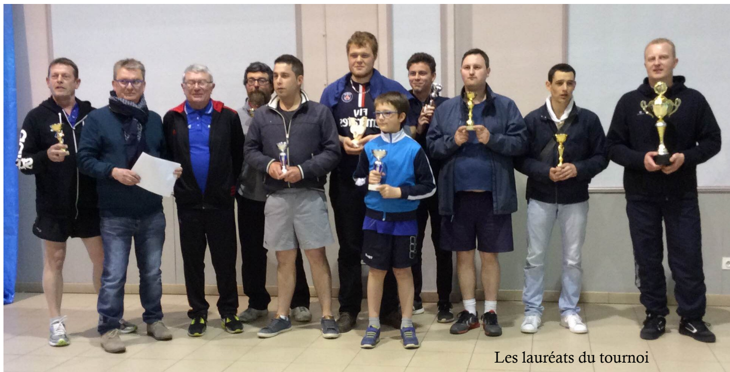
Les lauréats du tournoi