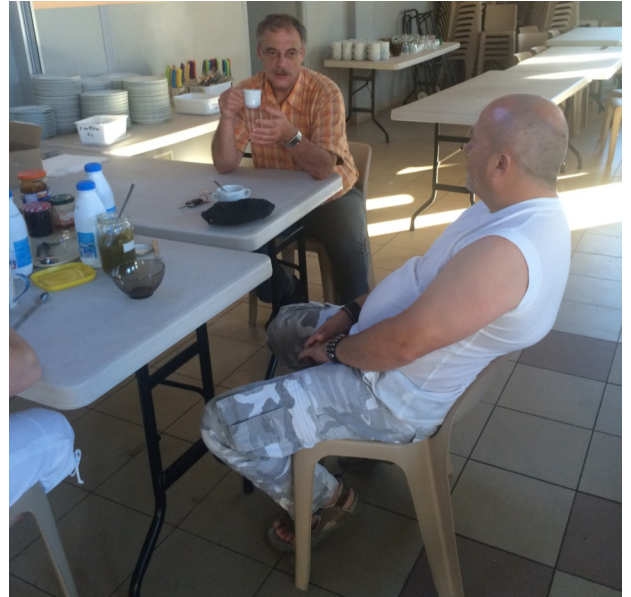
Une visite matinale : Monsieur le Maire partage un café avec des membres de l'équipe logistique.

Des ateliers dans d'anciens logements, la salle de motricité, à l'école de musique ; à la maison de retraite, Epehy résonnait aux sons des clarinettes, saxophones, flûtes, trompettes, trombones.