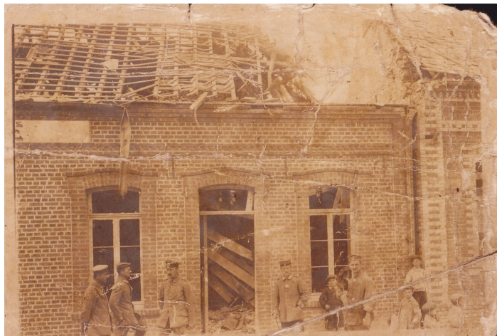
Maison Isèbe bombardée en 1916