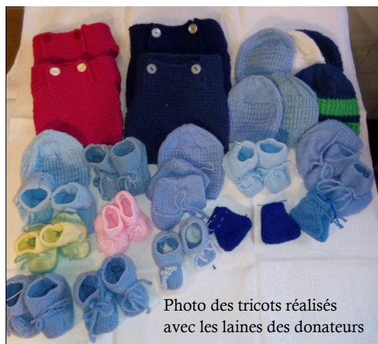
Photo des tricots réalisés avec les laines des donateurs