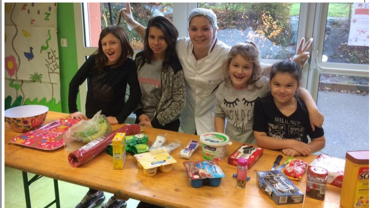
Les apprentis cuistos pour le goûter presque parfait !

* des activités manuelles sur le thème de Noël avec la fabrication d'une fresque pour la fête de Noël de l'école et des objets pour décorer le sapin à la maison.