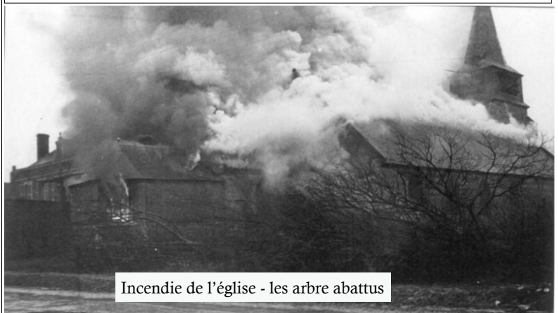
Incendie de l'église - les arbres abattus

À peine étions nous sortis d'Epehy que, de tous côtés, s'élevaient des incendies et des explosions : la dynamite achevait les maisons que les flammes n'avaient pas détruites. Tout fut rasé, les arbres coupés, les points d'eau comblés. Les rares pans de mur qui étaient restés debout malgré ce carnage, furent hachés par les milliers d'obus qui s'abattirent ensuite sur le pays.