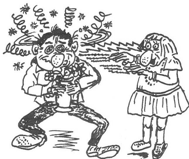
Dessin de l'affiche réalisé par Yvon Dobremé

N.B. On peut mieux connaître la troupe en allant sur le site Internet : http://epyserit.jimdo.com