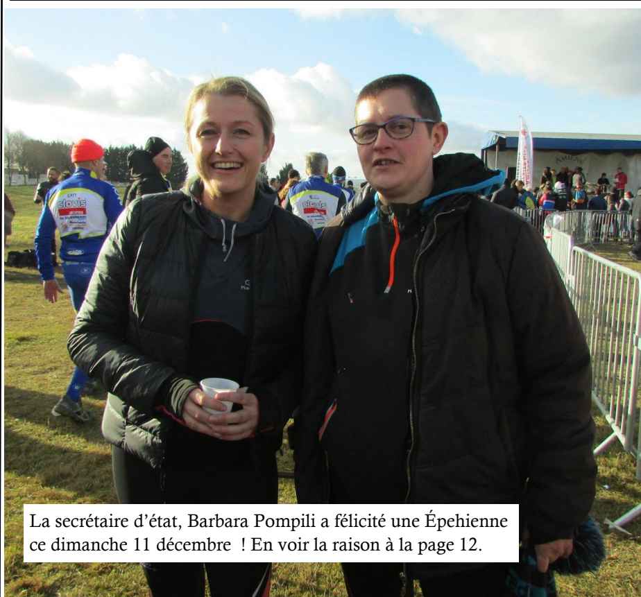
La secrétaire d'état, Barbara Pompili a félicité une Épehienne ce dimanche 11 décembre ! En voir la raison à la page 12.