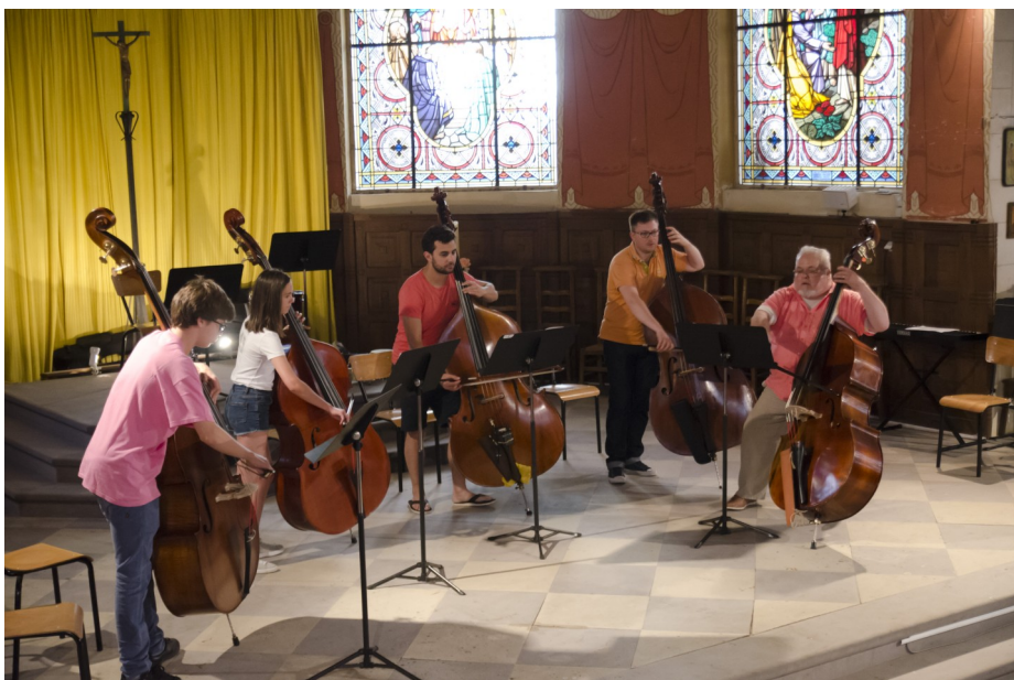
Les contrebasses à l'audition le mercredi dans l'église

La nouveauté cette année ? Les flûtes et les bassons au presbytère. Ce n'était pas prévu mais les travaux à la maison de retraite ne nous permettaient pas d'y accéder.