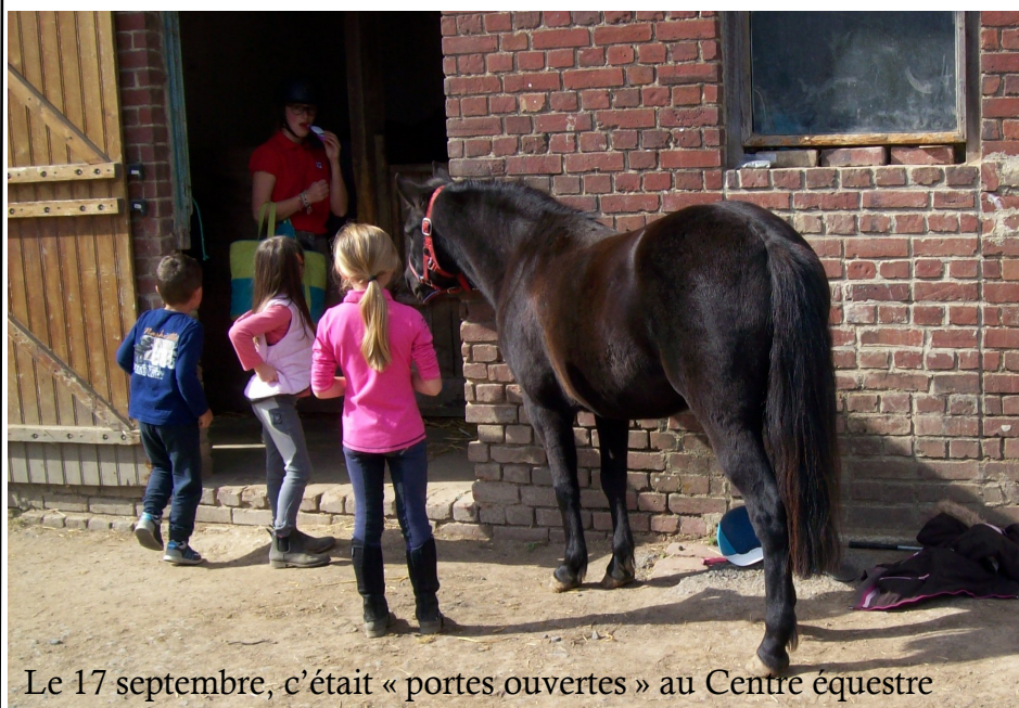
Le 17 septembre, c'était « portes ouvertes » au Centre équestre