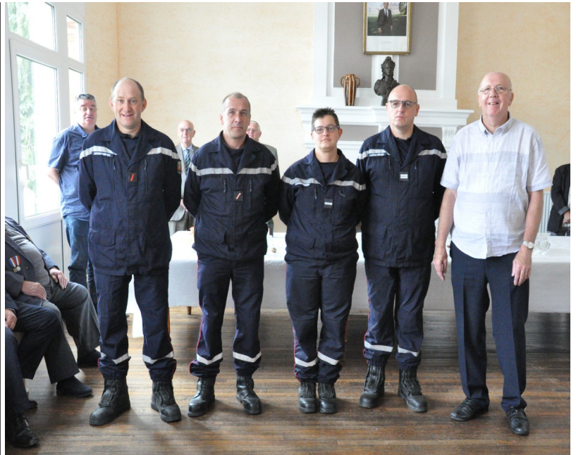
A l'occasion de la cérémonie du 14 juillet, ces pompiers ont été mis à l'honneur par la municipalité et félicités par leur chef.

Leur professionnalisme et leur action efficace ont permis d'héliporter la victime, dont le pronostic vital était engagé, dans des conditions idéales et sans aggraver son état. Comme le soulignait le lieutenant-colonel Charreau, commandant du groupement est de la Somme, la victime n'aurait sûrement pas remarqué sans les compétences de ces trois pompiers. Mais ceux-ci restent humbles : « Nous avons juste fait notre travail. Nous espérons que cela pourra inciter des personnes à venir nous rejoindre pour apprendre à sauver des vies. » Pascal Wydra