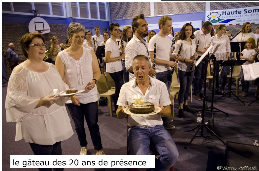
le gâteau des 20 ans de présence