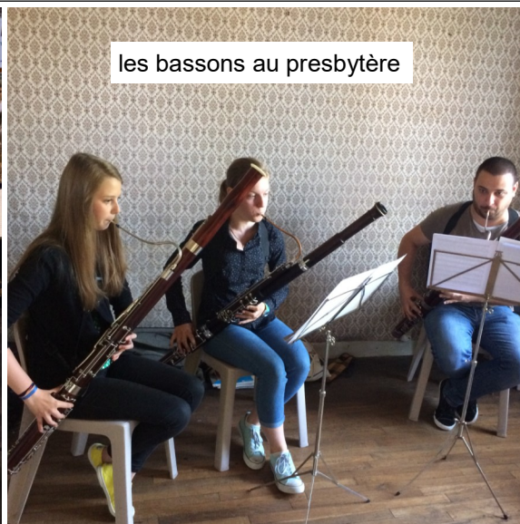
les bassons au presbytère