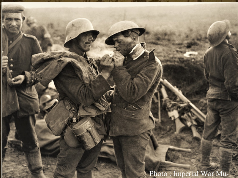
Un soldat britannique blessé et un soldat allemand prisonnier près d'Epehy partagent une cigarette, le 18 septembre 1918.