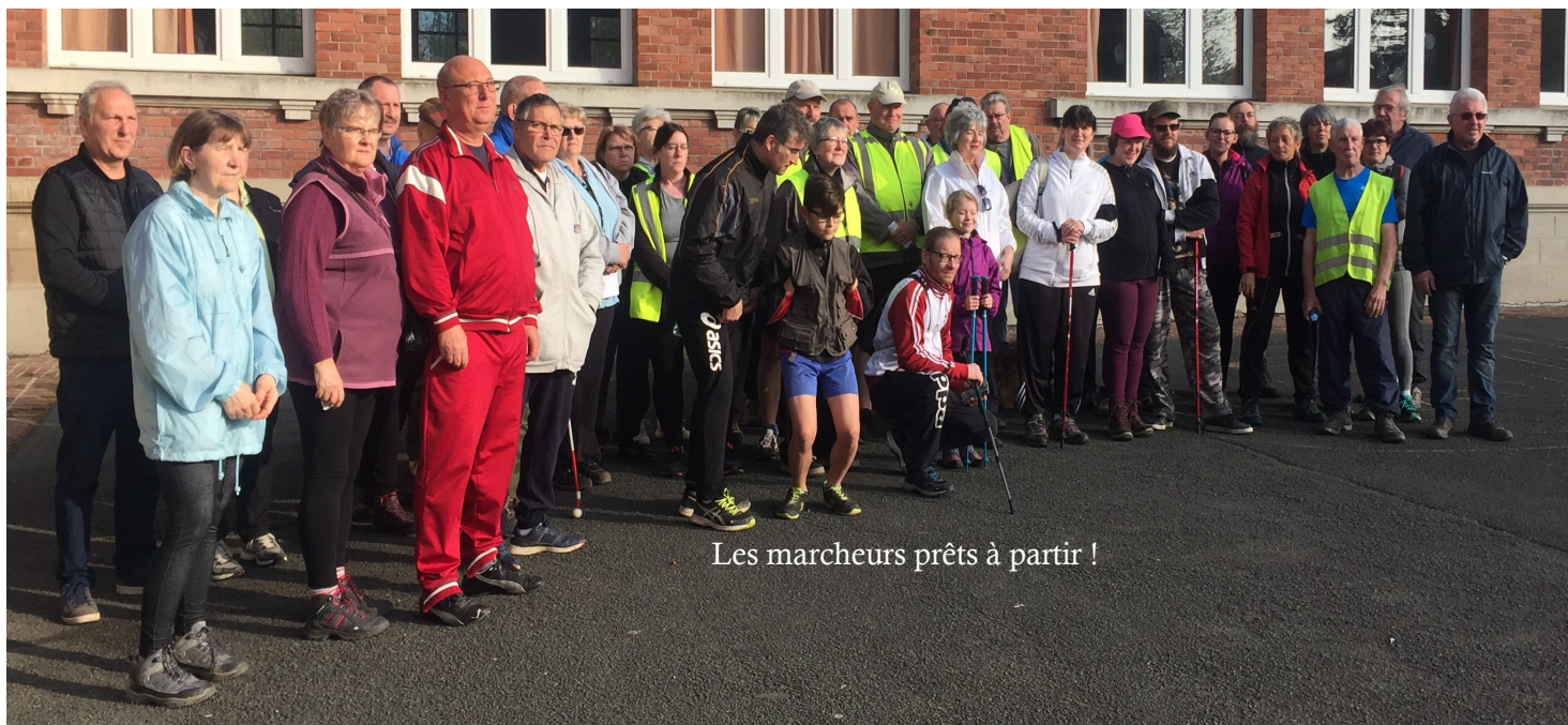
Les marcheurs prêts à partir !

Ce dimanche 15 avril, ce sont près de 90 marcheurs qui se sont retrouvés sous le préau de l'école pour une matinée sportive sous le signe de la randonnée pédestre, avec le beau temps en prime!