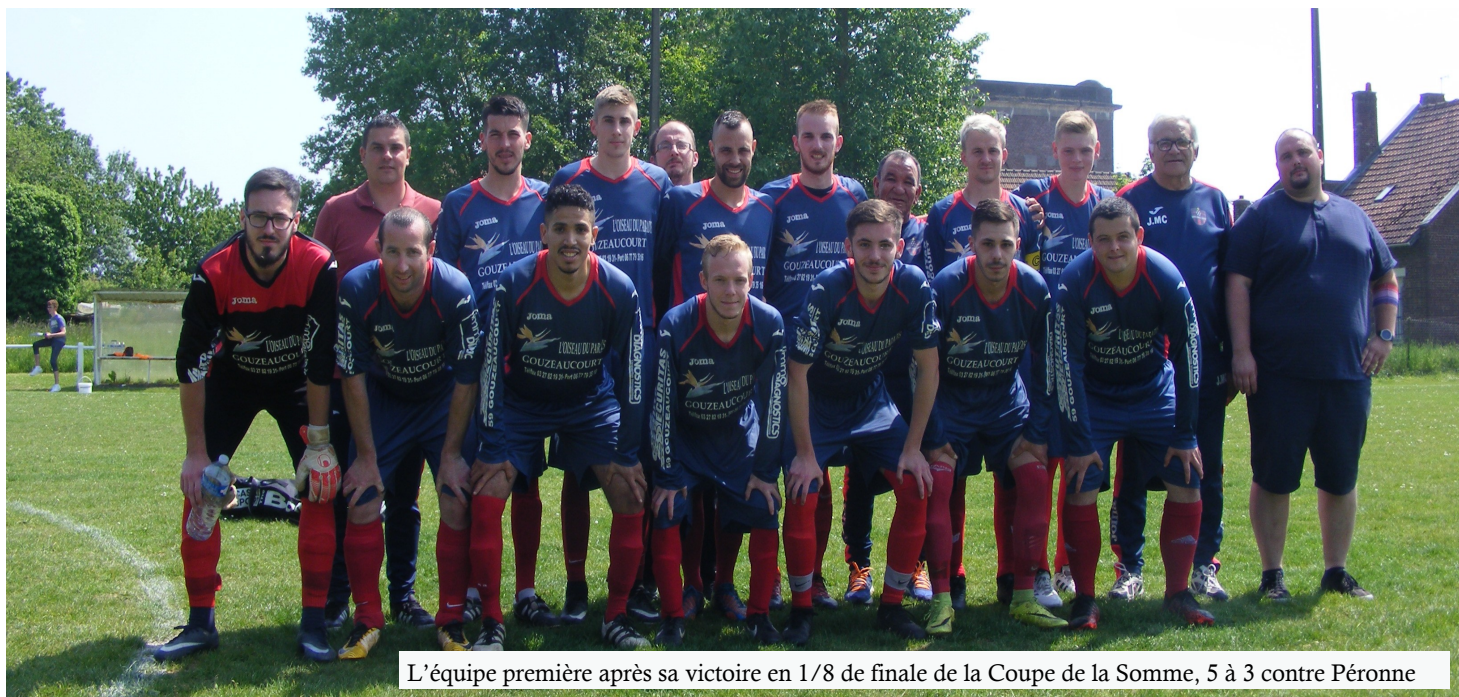
L'équipe première après sa victoire en 1/8 de finale de la Coupe de la Somme, 5 à 3 contre Péronne