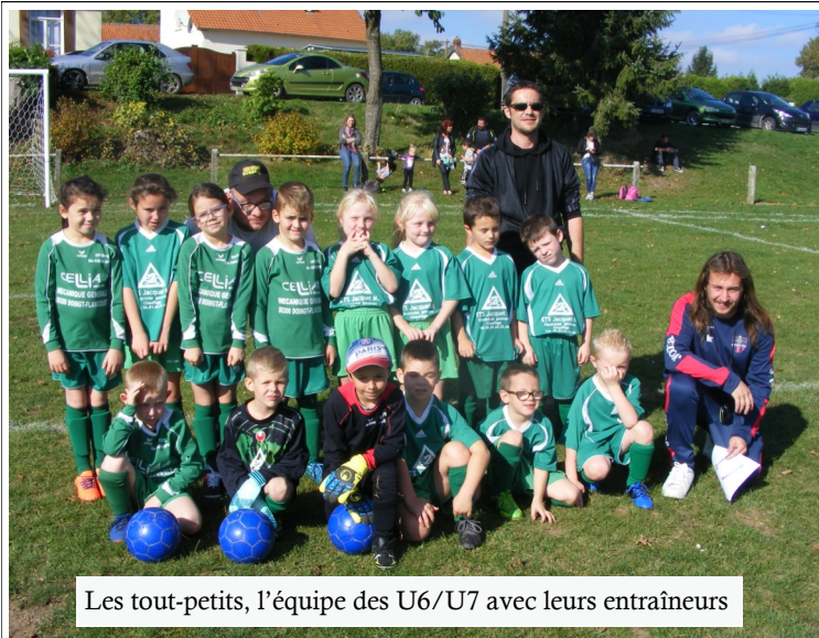
Les tout-petits, l'équipe des U6/U7 avec leurs entraîneurs

L'assemblée générale du vendredi 22 juin à Epehy a pu faire le bilan sportif de l'année 2017/2018. Ce fut une saison dense, longue et fatigante, en particulier pour l'entraîneur