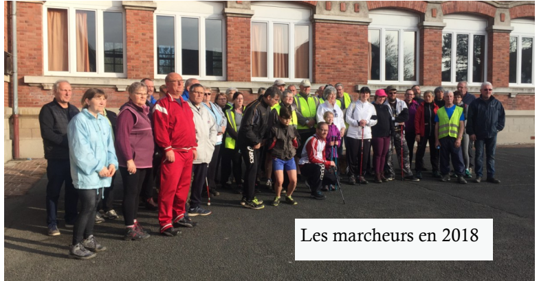
Les marcheurs en 2018