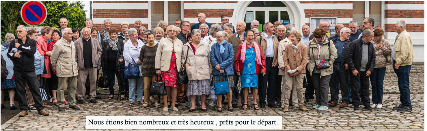
Nous étions bien nombreux et très heureux , prêts pour le départ.

Comme tous les 3 ans, ce jeudi 20 juin, le CCAS organisait son voyage. Les heureux bénéficiaires nous en font un compte-rendu.