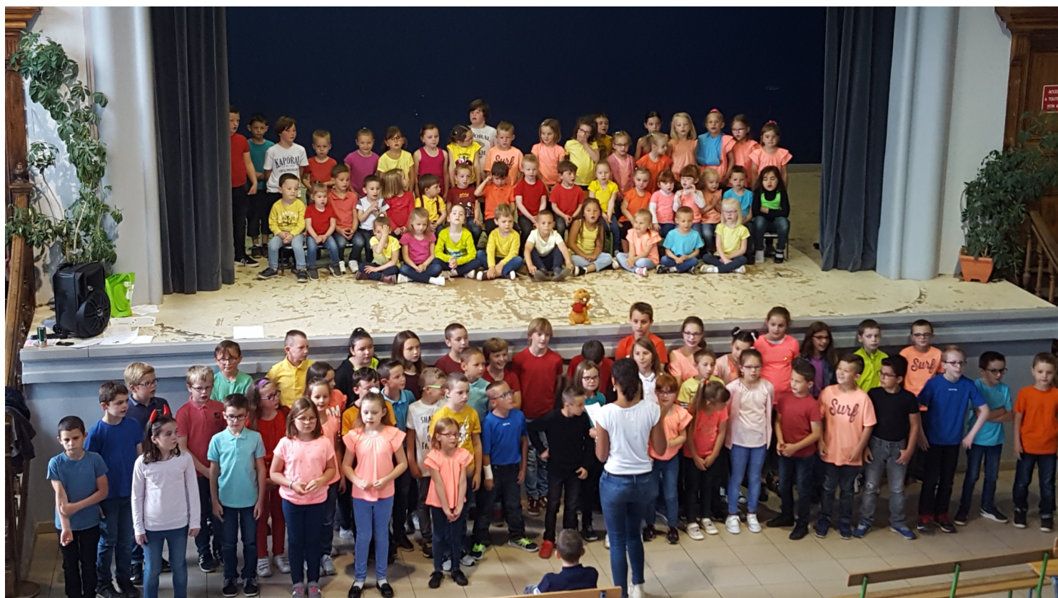
Les enfants au moment du chant final : Super méchant !