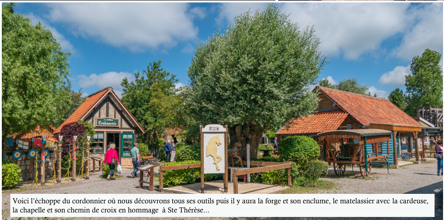
Voici l'échoppe du cordonnier où nous découvrons tous ses outils puis il y aura la forge et son enclume, le matelassier avec la cardeuse, la chapelle et son chemin de croix en hommage à Ste Thérèse...