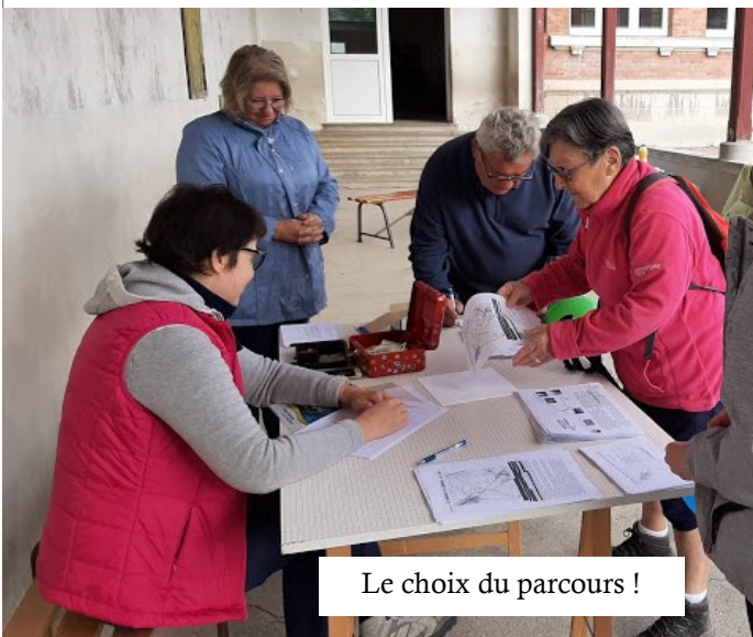
Le choix du parcours !

(Pour les personnes qui souhaiteraient retrouver ces différents parcours, il est possible de les télécharger sur le site Internet d'Epehy)