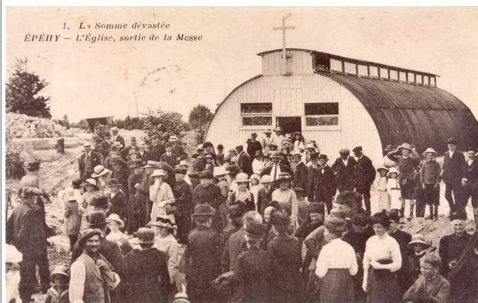
1. L. Somme dévastée ÉPÉHY - L'Église, sortie de la Messe

emplacement normal, la place de l'ancienne église. Une simple croix indique qu'il s'agit bien d'un édifice religieux. La photo semble avoir été prise en été. Est-ce l'été 1920 ? On observera à gauche, le tas de briques destinées aux reconstructions, ainsi que les rails d'un "decauville", un moyen de transport que l'on retrouve sur plusieurs photos de l'époque et qui a joué un grand rôle dans l'acheminement des matériaux depuis la gare jusqu'aux chantiers en cours.