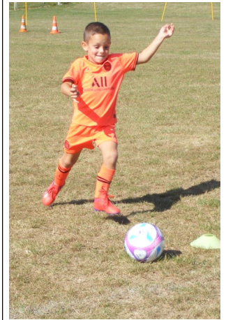
Un futur buteur