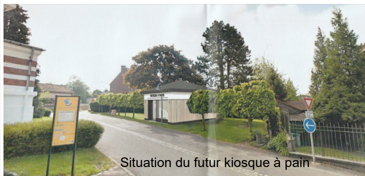
Situation du futur kiosque à pain

Après discussion, le conseil municipal valide le projet.