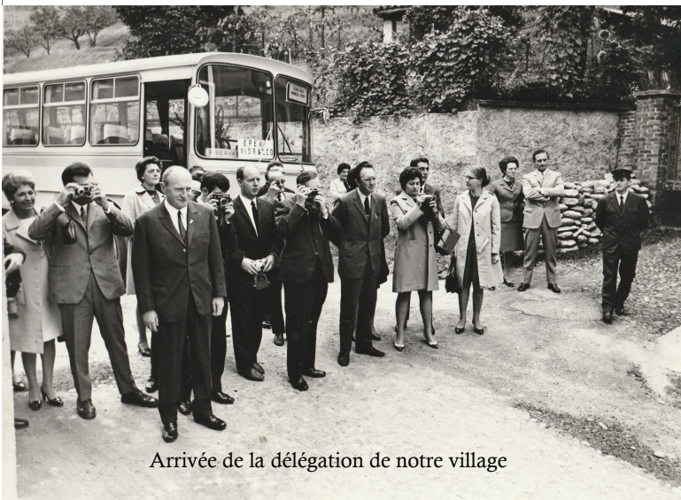
Arrivée de la délégation de notre village

Une délégation d'habitants d'Épehy (mais aussi des villages environnants) conduite par le Maire de l'époque se déplaça vers ce village piémontais en octobre 1969.