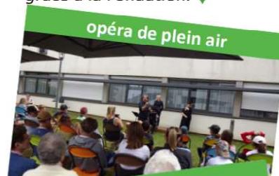
opéra de plein air