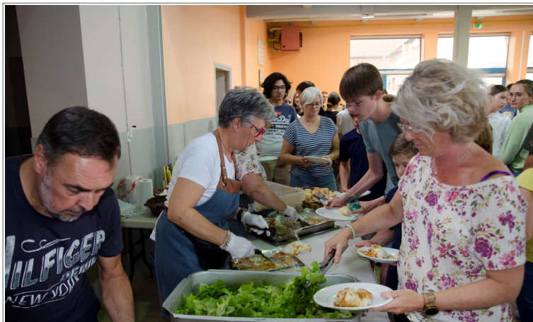
L'équipe d'intendance (des bénévoles !) n'a pas chômé pour nourrir tout ce monde.

Au total nous étions 130, comme avant cette fichue épidémie. De 9 à 81 ans... le panel est large, les capacités musicales tout autant. Mais chacun y a trouvé son compte. Bonne humeur, bienveillance, entraide sont les maîtres mots de la semaine.