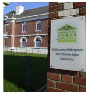
Animations, rencontres, réalisées grâce à la Fondation. ▼

L'Association permet aux résidents de participer à des manifestations, des sorties.