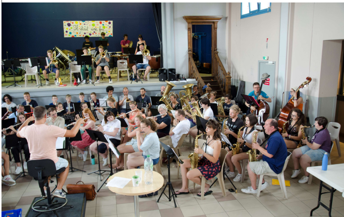
La salle des fêtes n'était pas trop grande pour réunir l'ensemble des stagiaires (une moitié ici)

Nous étions tous émus ce samedi 20 août et que dire du plaisir de se retrouver. Deux ans sans stage, jamais on n'aurait pu l'imaginer. Mais voilà, s'il est vital pour les finances de l'école et de l'orchestre, ce temps fort musical l'est également sur le plan humain.