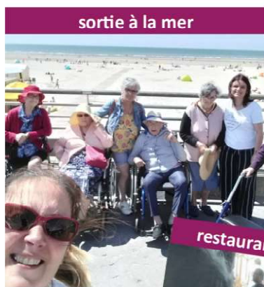
sortie à la mer