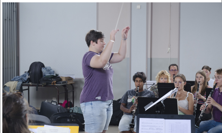
Deux jeunes stagiaires ont participé à un stage de direction d'orchestre .

Sans le soutien de la municipalité, l'aventure serait impossible. Alors un grand merci à vous tous, Monsieur le Maire, Mesdames et Messieurs les élus, habitants d'Epehy de soutenir cet événement.