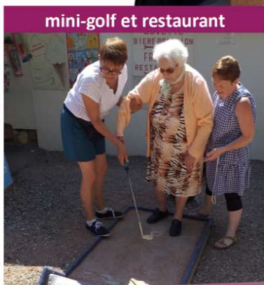
mini-golf et restaurant