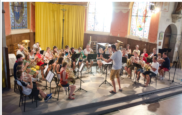
Divers lieux du village étaient utilisés pour faire travailler les stagiaires et l'égaler pour un petit concert