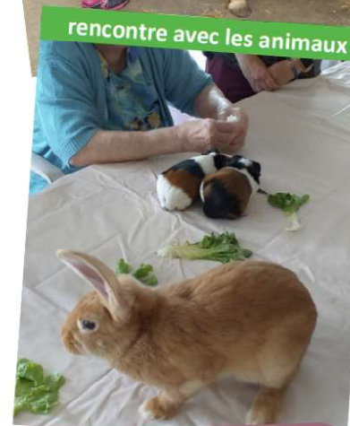
rencontre avec les animaux