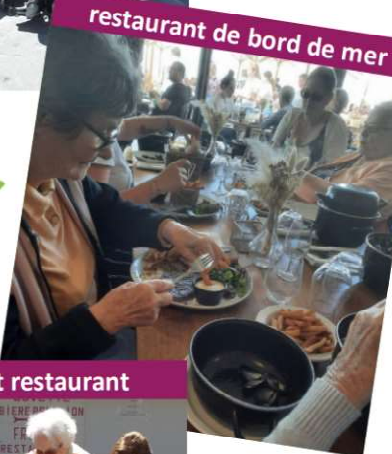
restaurant de bord de mer