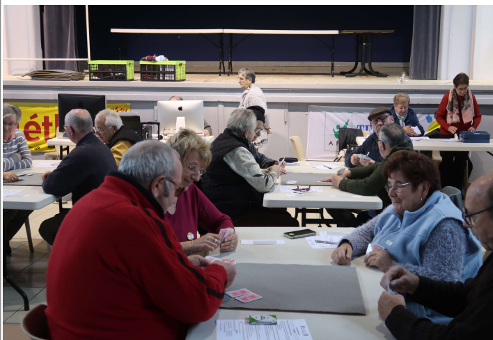
Les AFN avaient organisé un concours de belote

N'est-il pas exceptionnel de voir que, rien que pour notre village, 62 bénévoles se sont investis, sans compter les membres des associations qui ont participé comme les pompiers qui ont proposé le lavage de voitures, les animateurs de Vacances Plurielles qui maquillaient les enfants ou vendaient des objets fabriqués, les judokas, les musiciens, etc... On peut vraiment parler d'un élan solidaire.