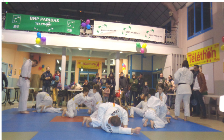
Les judokas sont toujours fidèles à cette manifestation

Après deux années où la Covid avait empêché de belles réunions, les festivités au profit du téléthon ont pu reprendre à Epehy. Les associations et les nombreux bénévoles ont pu de nouveau se montrer solidaires, donner de leur temps, de leur énergie pour que notre village reste un exemple à l'occasion de cet événement caritatif avec ses deux jours de manifestations et prouver que ses habitants ont du cœur.