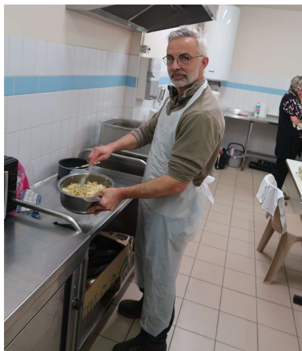
Le cuisinier a travaillé pendant les deux jours

D'autres photos sont visibles sur le site d'Epehy