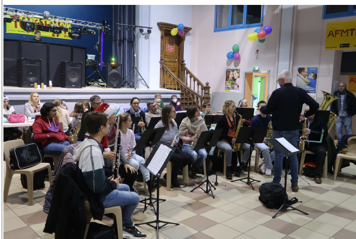
La classe d'orchestre n'a pas manqué de participer

Bien sûr, on pourra regretter qu'à certains moments, il y avait moins de monde que par le passé mais nous savons tous que la pandémie a laissé des traces et certains habitués n'ont pas osé sortir d'autant plus qu'une nouvelle vague était annoncée. Toutefois on ne peut qu'être satisfaits non seulement de la mobilisation mais aussi de la somme qui reviendra à l'AFM.