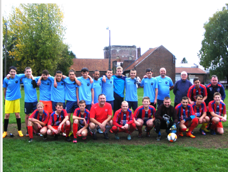
Photo souvenir d'un match de plaisir, fin juin, entre joueurs, parents U14, U15, U16

Les U18/U19 (années 2005-2006), encadrés par Marceau Boitel et Romain Dollez, se comportent au-delà de toutes espérances. Ils ont obtenu une qualification méritée en coupe de la Somme contre Montdidier 2-2 (vainqueur aux tirs au but 4-1)