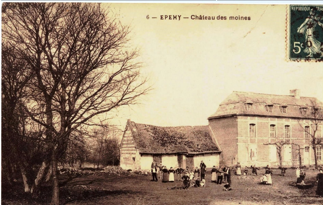
6 — ÉPEHY — Château des moines

Les historiens considèrent ce mouvement social de 1775 comme un signe avant-coureur de la Révolution. Les habitants d'Épehy et de Pezières ne voyaient probablement pas si loin, et peut-être ne s'agissait-il pour eux que d'une façon de survivre à la disette, mais la concomitance des faits donne à penser qu'ils vivaient cependant bien en phase avec ce qui se produisait dans le reste du royaume.