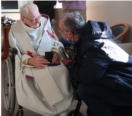
Monsieur Le Maire remettant, à l'abbé, la médaille avec l'arbre de vie

chouettes souvenirs qui ont permis de souligner combien l'abbé avait le sens du service des autres, un esprit ouvert, combien sa gentillesse mais aussi sa ténacité étaient remarquables, que son grand âge ne l'empêchait pas d'aller régulièrement visiter les autres résidents.