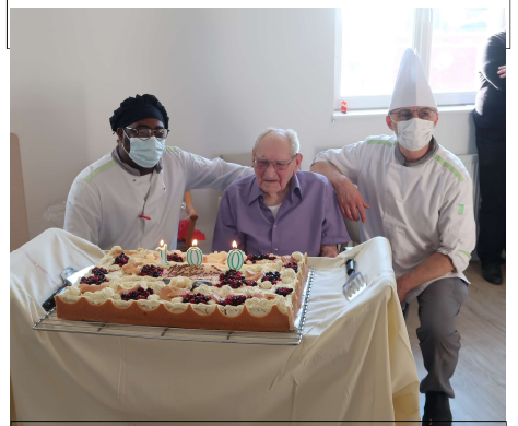
Les deux cuisiniers pouvaient être fiers de leur œuvre ! Heureusement qu'ils n'ont pas dû mettre 100 bougies !

Pour terminer, les deux cuisiniers de l'établissement ont apporté le superbe et succulent gâteau qu'ils avaient réalisé et le verre de l'amitié fut partagé.