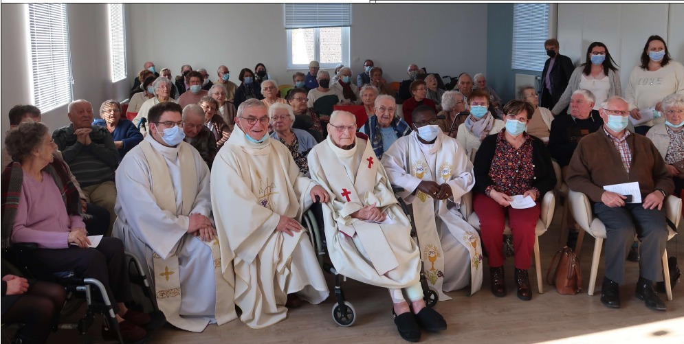
La famille, les prêtres, les résidents, le personnel, tous étaient très heureux de fêter cet anniversaire, la grande salle n'aurait pas pu recevoir plus de monde