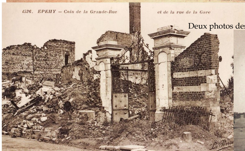
et de la rue de la Gare

Le bâtiment occupé par ce tissage est imposant, comme on peut s'en rendre compte sur les photos (ci-dessus et ci-contre) et les Allemands y installèrent leur Kommandantur pendant la Première Guerre.