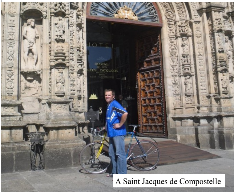
A Saint Jacques de Compostelle

Compostelle, jusqu'à la cathédrale de Santiago de Compostelle lieu de pèlerinage s'il en est. J'ai ensuite poursuivi la route vers le Maroc en rejoignant Porto. Sur la route de Porto à Lisbonne, j'ai découvert le monastère de Bathala et un autre lieu de pèlerinage à la gloire de la Vierge : Fatima. Et j'ai alors rejoint Gibraltar en passant par Séville. Pour enfin, après une heure de bateau me retrouver sur le continent africain. Au total 3 685 km en 44 jours dont 37 sur le vélo... »