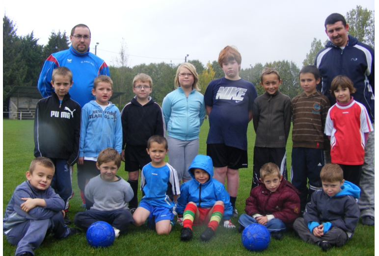
Les jeunes à l'entraînement... Au premier rang, les plus jeunes : 5 ans-6 ans