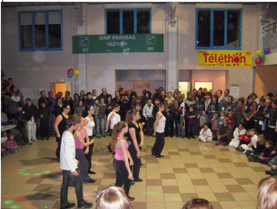
Unydanse a charmé le public du Téléthon