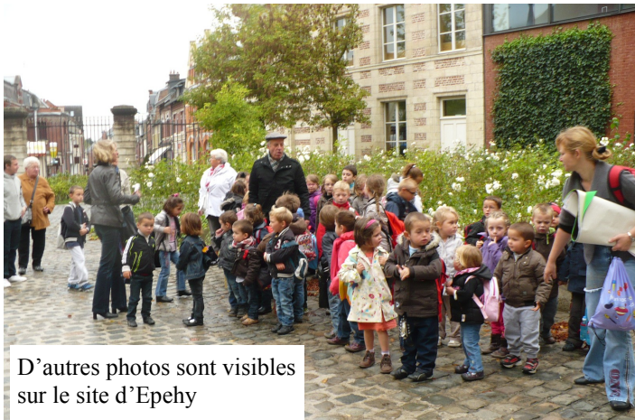
D'autres photos sont visibles sur le site d'Epehy

Ensuite, nous avons pu admirer quelques tableaux de l'artiste et participer à un atelier avec des animateurs expérimentés. C'est là que nos petits artistes en herbe ont pu s'exprimer et bien souvent nous ont surpris par leur don !