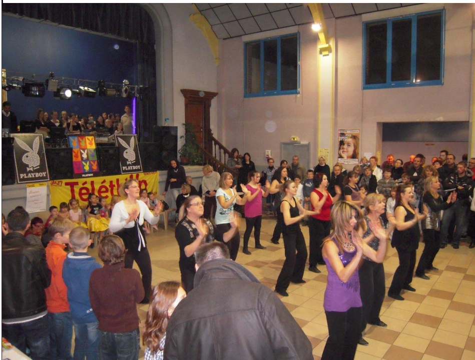
Les intempéries ont perturbé la grande fête du téléthon des 3 et 4 décembre mais la solidarité ne s'est toutefois pas démentie à Epehy