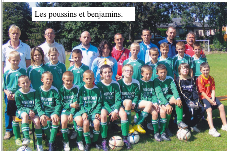
Les poussins et benjamins.