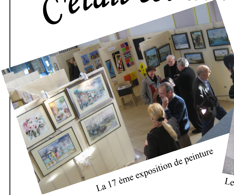
La 17 ème exposition de peinture