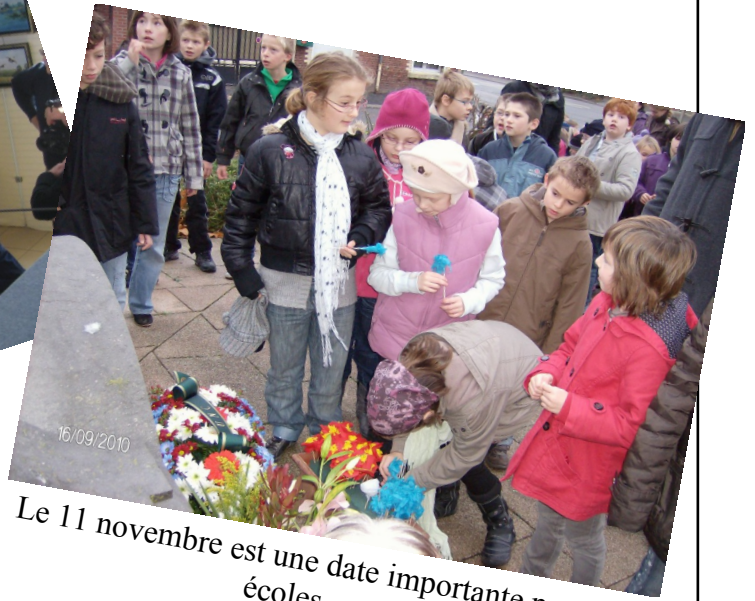
Le 11 novembre est une date importante pour les écoles