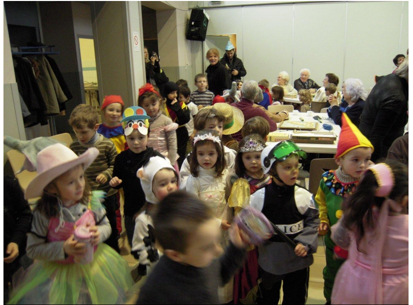
De nombreuses autres photos sont visibles sur le site Internet d'Epehy

Vers 15h, ils sont partis en défilé jusqu'à la salle des fêtes où les attendaient les membres fidèles du club. Ils ont accepté de faire une petite pause dans leur partie de scrabble, belote ou autre pour admirer les enfants, les écouter chanter et partager avec eux un bon goûter préparé avec soin. Un goûter, mais pas seulement, ce fut le moment de faire connaissance : et toi tu habites où ? Et t'es l'enfant à qui ? ... Des questions auxquelles les petits essayaient de répondre avec application afin de se