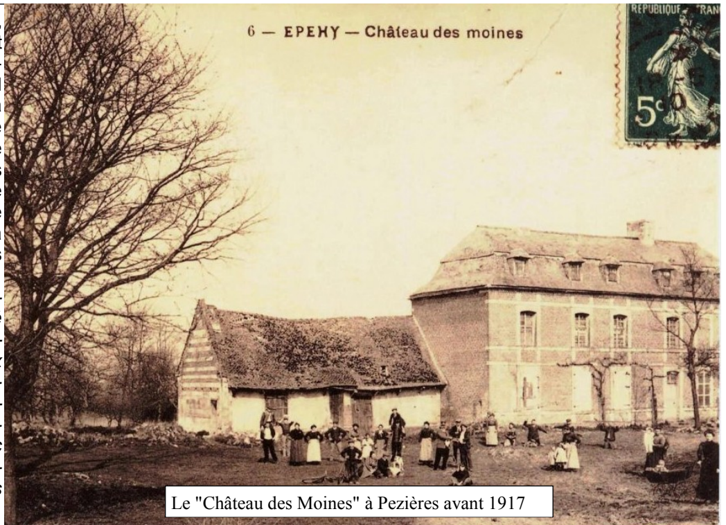
Le "Château des Moines" à Pezières avant 1917

"En 1912-13, notre grand plaisir était de visiter ce Prieuré abandonné ... . Pas trop rassurés, nous explorions les lieux avec les moyens du bord : bougies, allumettes, lanterne-tempête. On y retrouvait les accès aux souterrains, mais avec une curiosité prudente, nos investigations n'ont jamais été plus loin que le bâtiment"