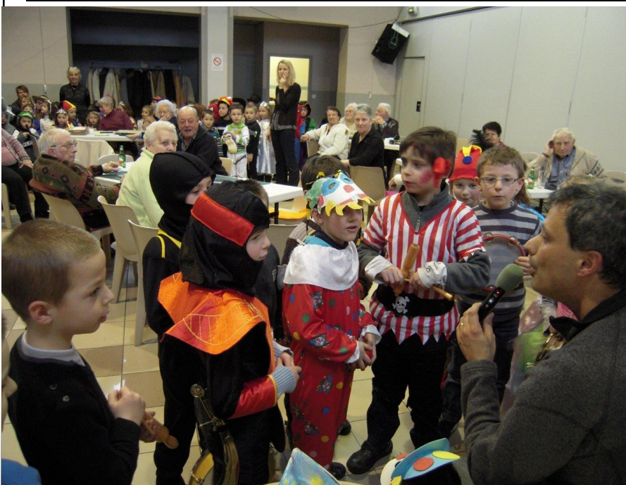
Le jeudi gras avec l'école et le club Loisirs à la page 5