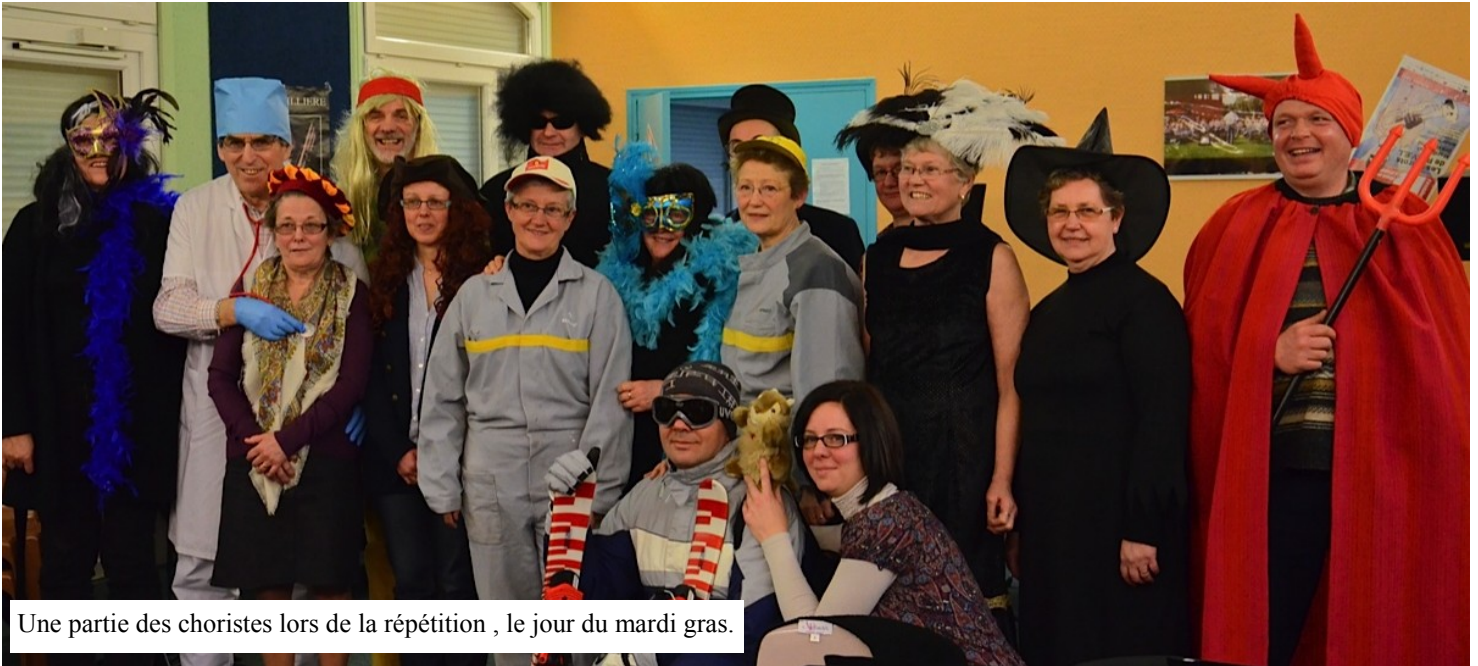
Une partie des choristes lors de la répétition, le jour du mardi gras.

(Non, il n'y a pas d'erreur d'orthographe ! Mais la chorale est bien la muse de chaque choriste, qu'on en juge...)