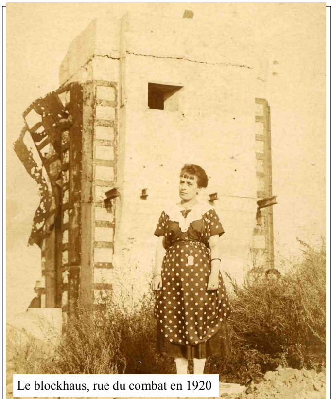
Le blockhaus, rue du combat en 1920

Nous avons des moyens donc pour proposer une belle manifestation mais, encore une fois, pour cela il est nécessaire que l'on sente une véritable attente chez les habitants et qu'il y ait suffisamment de passionnés qui commencent à la préparer dès maintenant pour pouvoir la faire labelliser et inscrire dans le