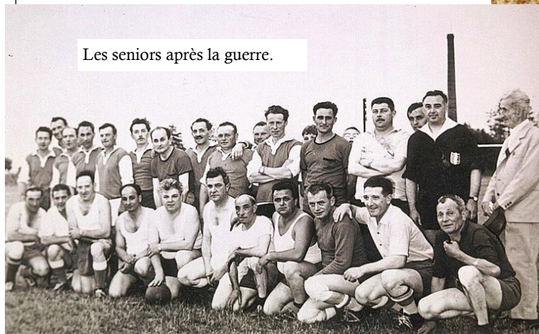
Les seniors après la guerre.