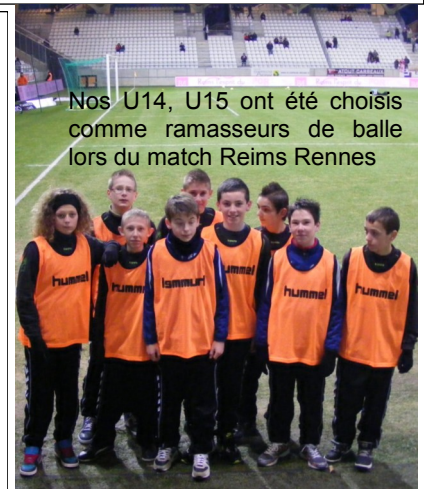
Nos U14, U15 ont été choisis comme ramasseurs de balle lors du match Reims Rennes

Emilie/Épehy souhaite engager des U12-U13 ans (années 2001-2002). Elle est donc prête à accueillir de nouveaux « Footeux ». Vous pouvez vous adresser aux différents dirigeants que vous connaissez ou à moi-même au 06 59 56 94 52 ou 06 19 67 01 28.