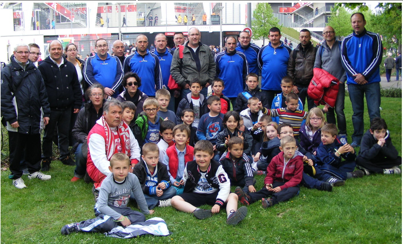
Le club a eu le privilège en deux occasions d'être invités par le club de Reims, Voici notamment les U6 U7 U8, U9, avec les encadrants, devant le stade Delaune pour le match Reims Ajaccio