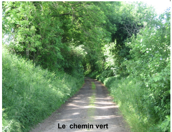
Le chemin vert

Cette balade étant gratuite et ouverte à tous, espérons que nombreux sont ceux qui se seront inscrits avant le 3 juillet pour en profiter.