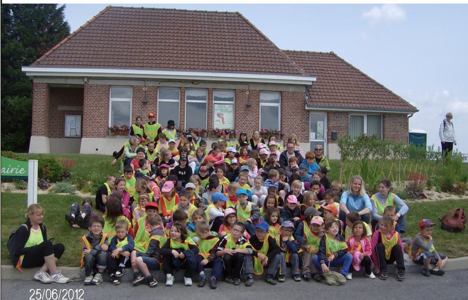
En cette fin juin, les élèves de l'école sont allés à pied à Guyencourt, dans le cadre de leur projet « Autour du jardin » voir page 6 et sur le site d'Epehy.