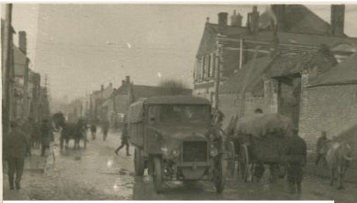
Pendant l'occupation devant le 2 actuel de la rue Raoul Trocmé